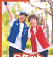
ロケット くれよん (13:30~)